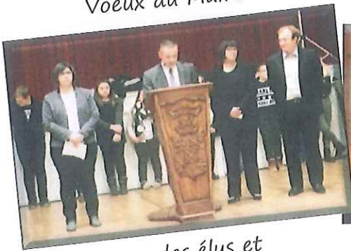
Voeux du Maire