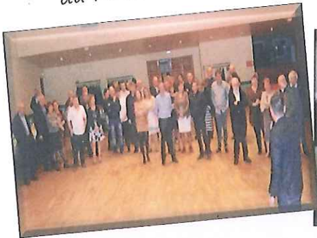
Repas des élus et du Personnel Communal