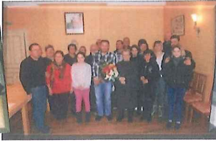
Réception des Forains pour la Fête Saint Vincent