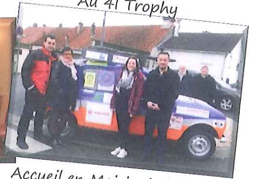
Participation du CCAS Au 41 Trophy