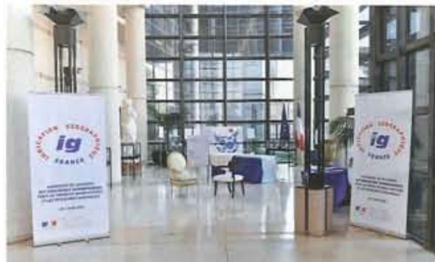
Exposition sur les Indications Géographiques « produits manufacturés » en juin à Bercy.

Pour faire reconnaître la spécificité de leurs savoir-faire dans un contexte de concurrence ouverte, les membres du PLAB (Pôle Lorrain de l'Ameublement Bois) sont engagés dans une démarche d'Indication Géographique Protégée, qui devrait se traduire dès 2016 par un label.