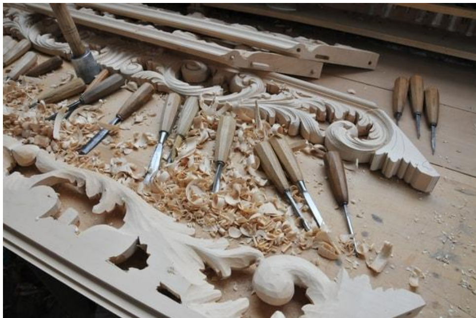
Le Siège de Liffol a désormais son IG