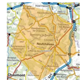
aire géographique de l'IG Siège de Liffol

L'aire géographique de l'Indication Géographique du SIEGE DE LIFFOL couvre les communes sur trois départements de Haute-Marne, Meuse, et Vosges, dans un rayon de 25 km autour de Liffol le Grand.